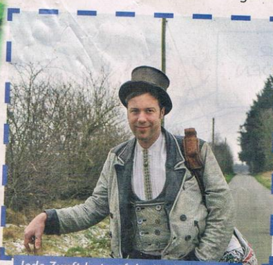
Jede Zunft hat auf der Walz ihre eigene Kluff: Die Bäcker tragen die hellste mit feinem Pepitamuster.

„Bist ein feiner Kerl, aber ich hab gerade einen Junggesellen losgeschickt oder „Wir beiden passen nicht zusammen.“ Er täuscht macht sich der damals 22-jährige auf den langen Heimweg. Er klammerte sich an die Aussicht dass zwei Wochen später, wenn von Trier aus viele Gesellen ihre Wander