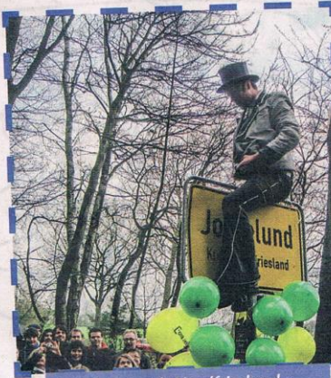
Rückkehr nach Nordfriesland – kein leichter Schritt.

spezielles Nähhandwerk, denn jede Zunft hat ihr eigenes Outfit für die Walz: die Holzgewerke schwarz, die Mineraliengewerke grau und beige, die Metallgewerke blau und die Lebensmittelgewerke klein kariert Pepitastoff. Neben Hose, Jacke und Weste gehöre dazu der Hut und für